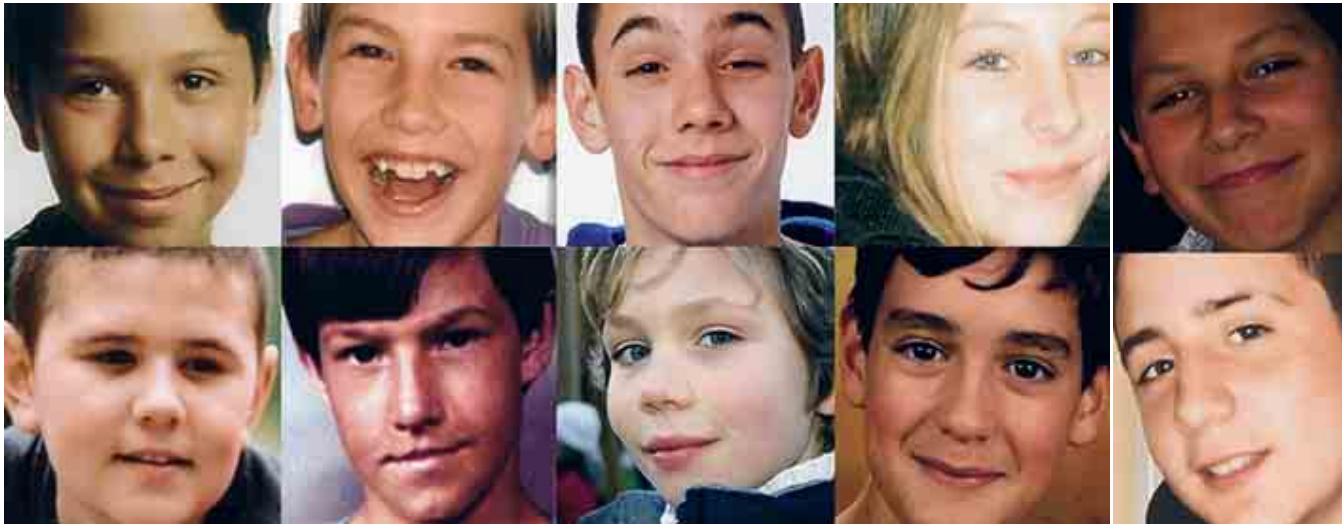
In Frankrijk eist 'le jeu du foulard' elke maand een leven. De Franse vereniging Apeas voert met deze foto's van de jonge slachtoffers campagne tegen het spelletje.