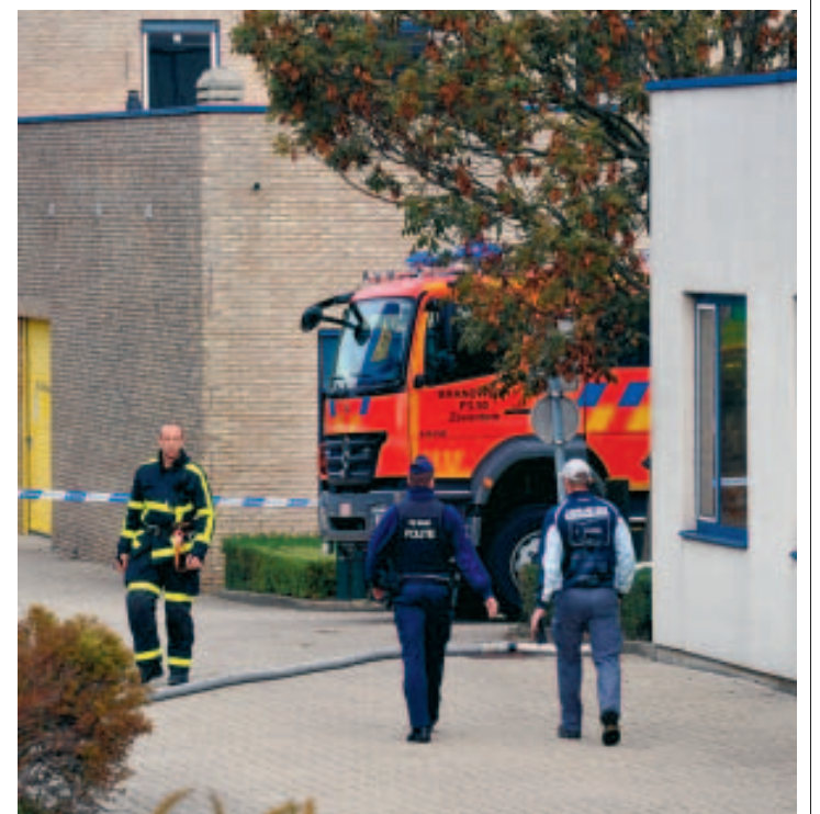
B. La fuite a été rapidement maîtrisée. ■ LAURENT LANGE

L'opération a nécessité le renfort des pompiers de Bruxelles et de Louvain. «